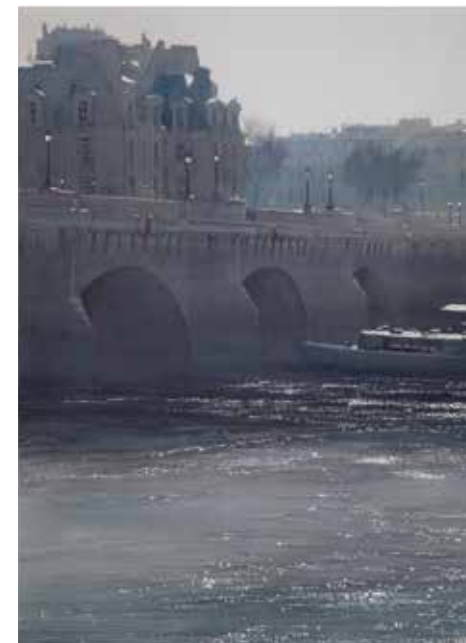
Paris - Le Pont Neuf • 100x80 cm aquarelle et encre sur papier • 2017