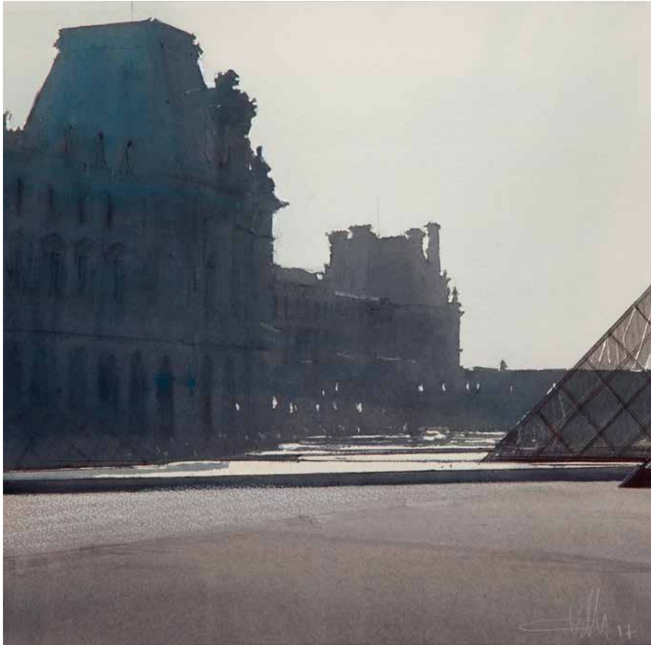
Paris - Le Grand Louvre • 38x38 cm • aquarelle et encre sur papier • 2017