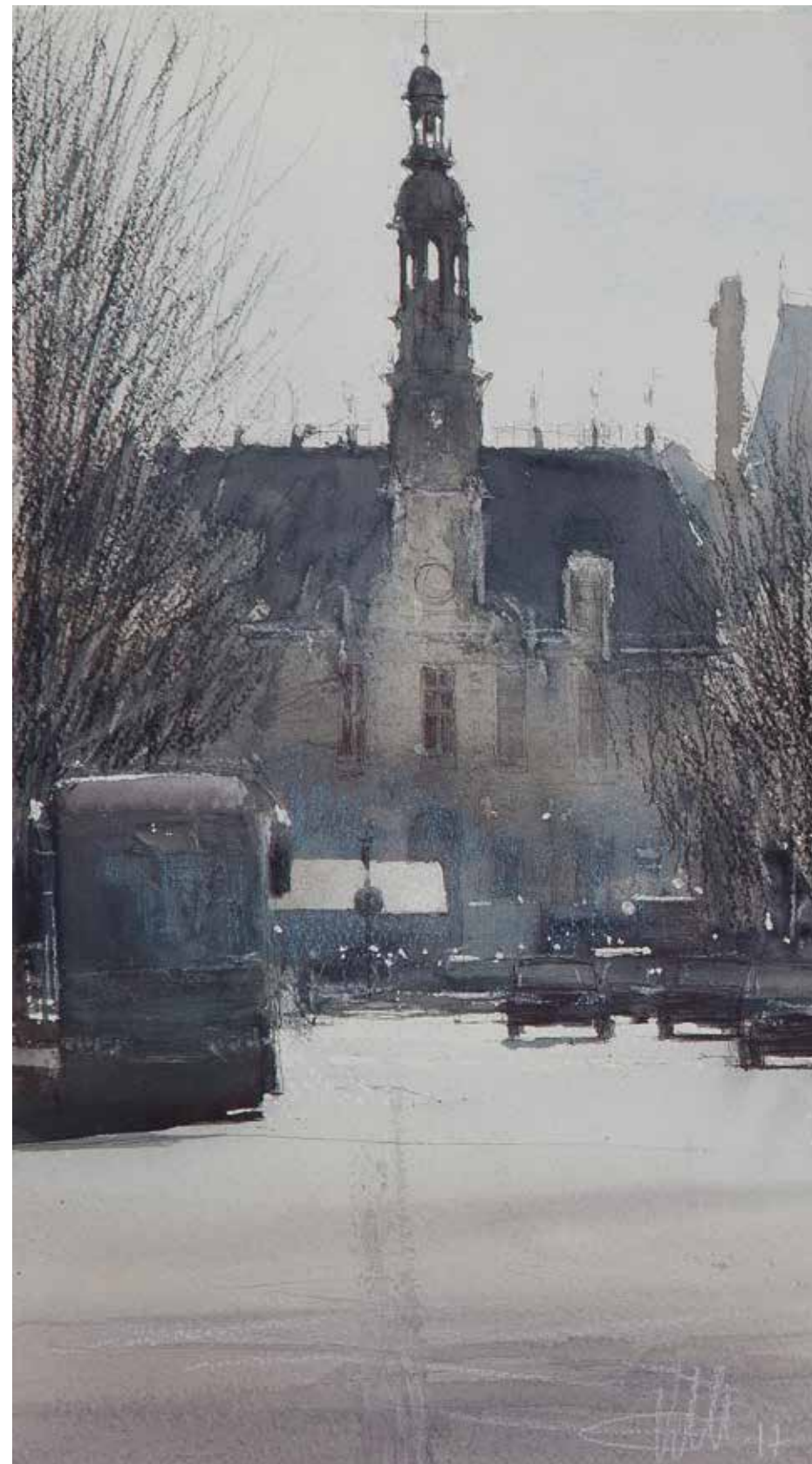
Paris - l'Hôtel de Ville • 20,5x37,5 cm • aquarelle et pierre noire et encre sur papier • 2017