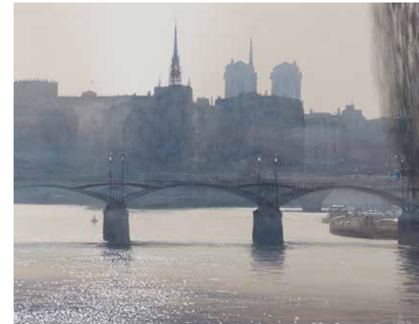
Paris - Le Pont des Arts • 80x95 cm aquarelle et encre sur papier • 2017