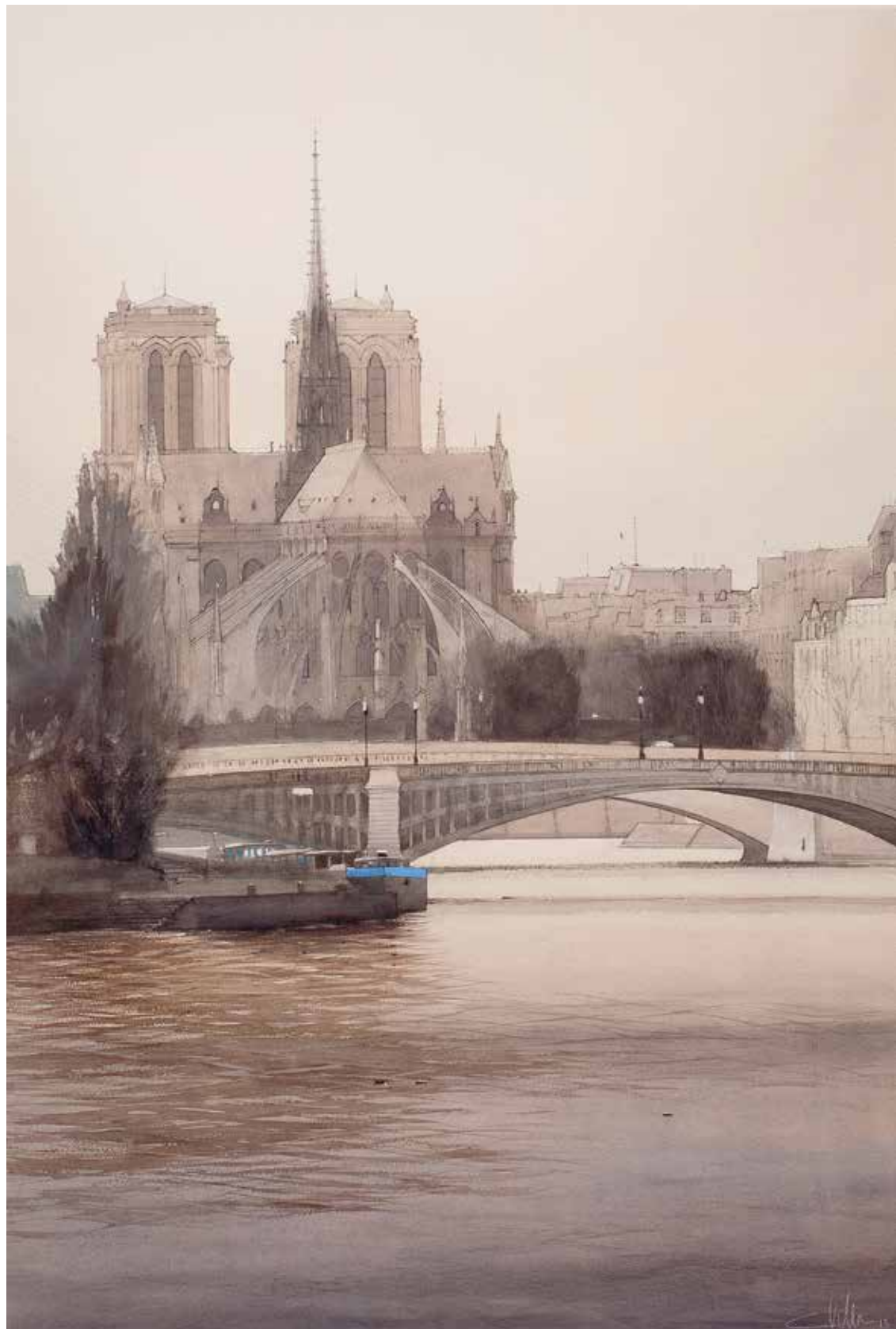
Paris - Notre-Dame • 122x87 cm • aquarelle sur papier • 2013