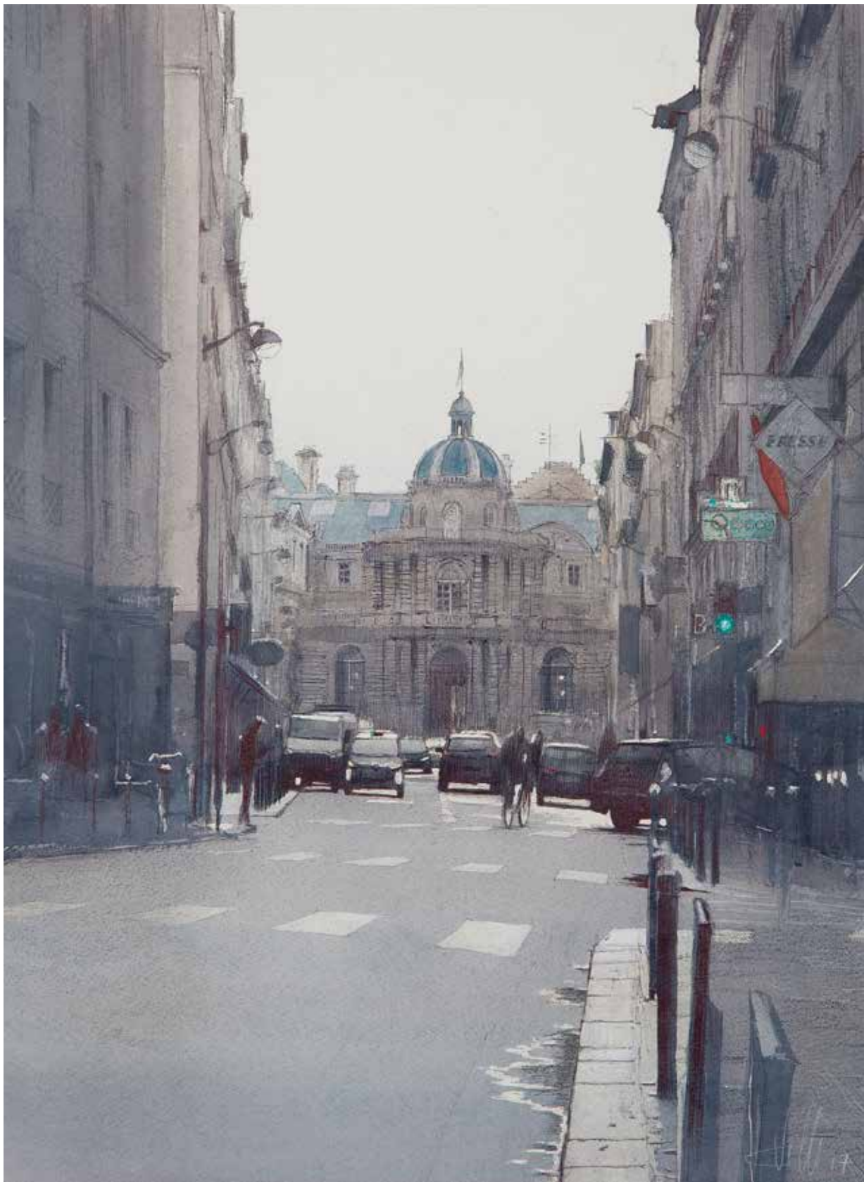
Paris - Rue de Tournon • 54x40,5 cm • aquarelle et encre sur papier • 2017