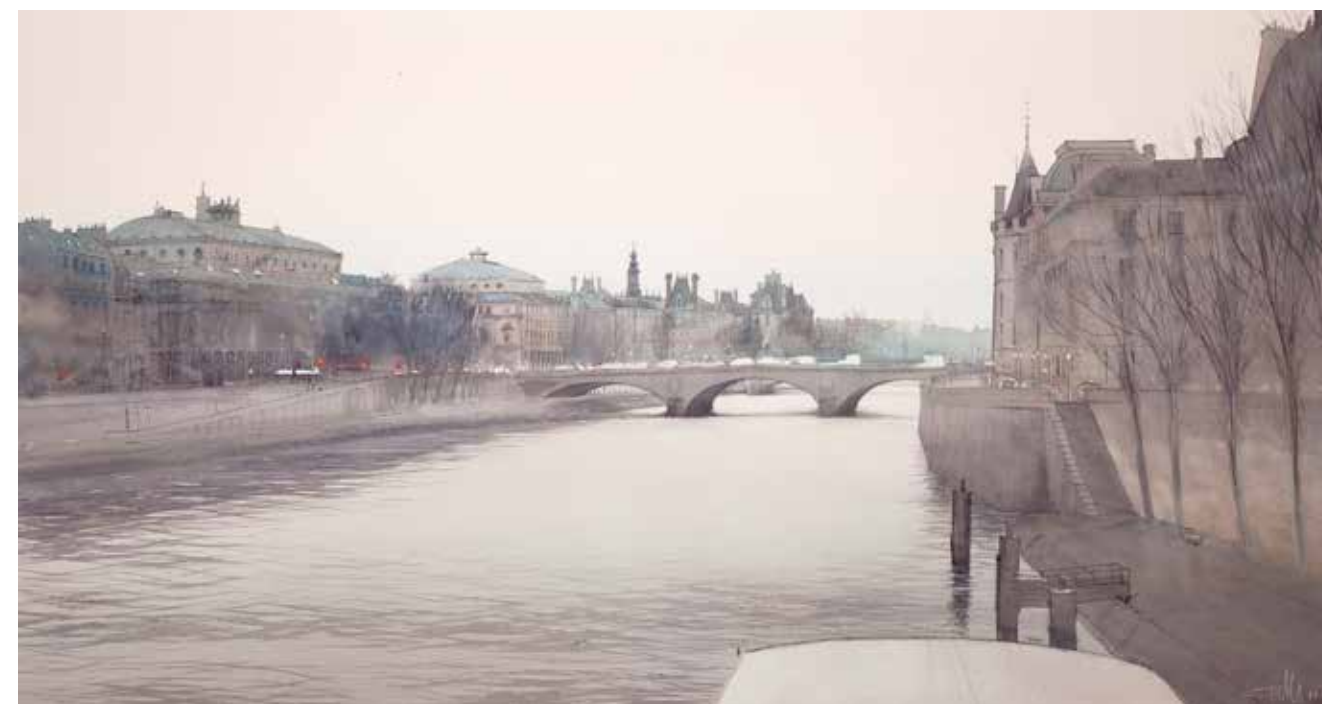
Paris - Quai de l'Horloge • 80x120 cm • aquarelle et encre sur papier • 2017