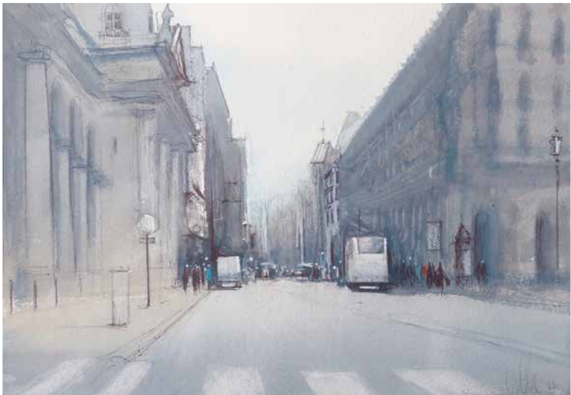
Paris - Rue du Faubourg Saint-Honoré • 26.2x38 cm aquarelle et encre sur papier • 2017