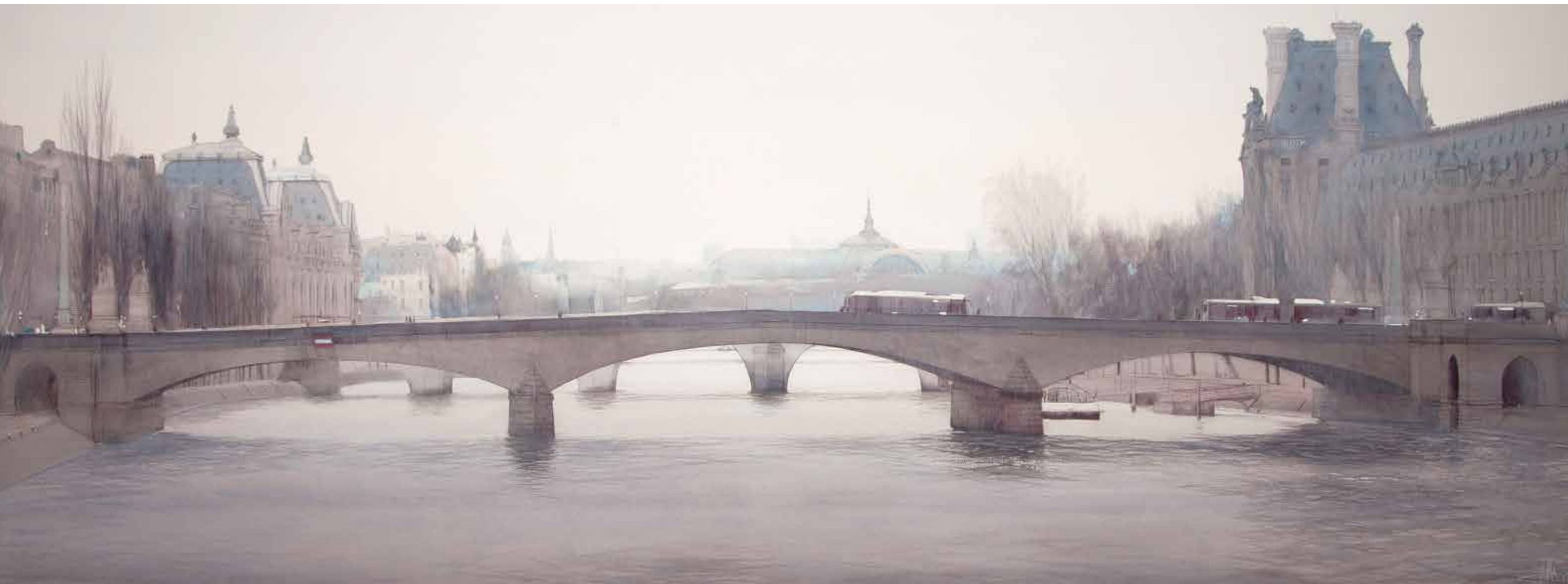
Paris - Le Pont du Carrousel • 95x240 cm • aquarelle et encre sur papier • 2017