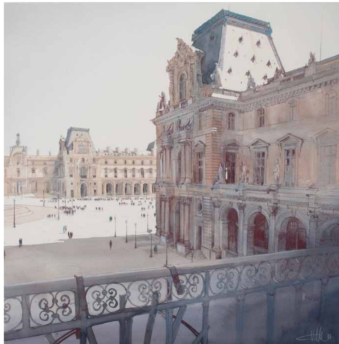
Paris - Musée du Louvre - Pavillon Mollien • 65x65 cm • aquarelle et encre sur papier • 2017