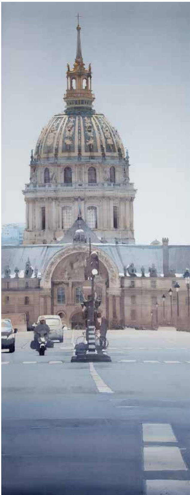
Paris - Hôtel des Invalides • 200x92 cm aquarelle et encre sur papier • 2017