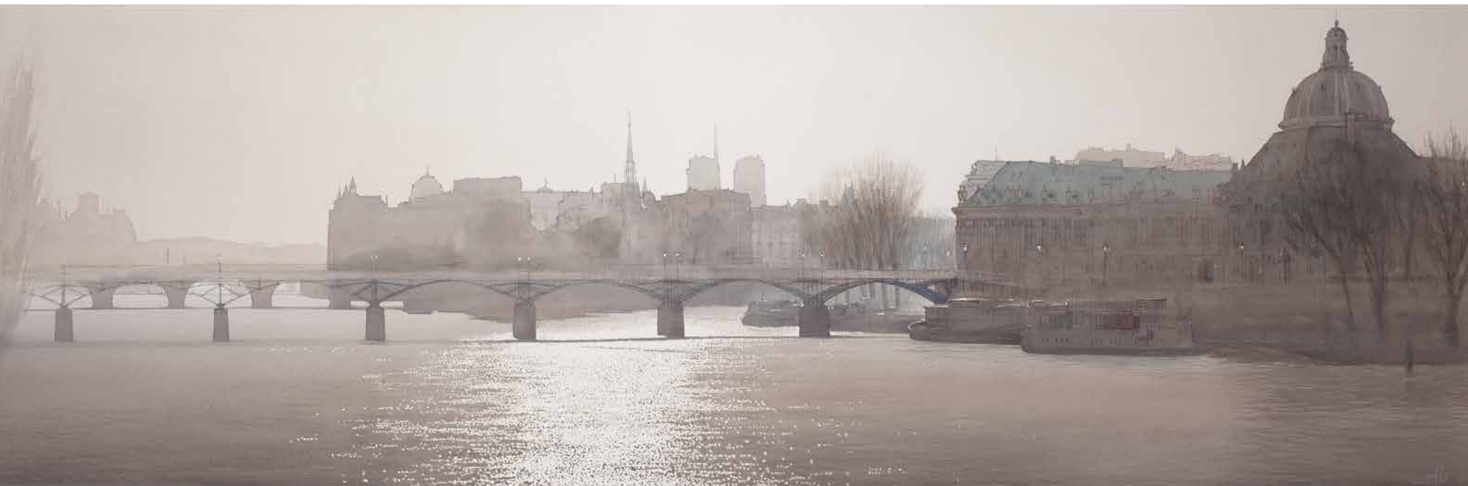
Paris - Le Pont des Arts • 95x240 cm • aquarelle et encre sur papier • 2016