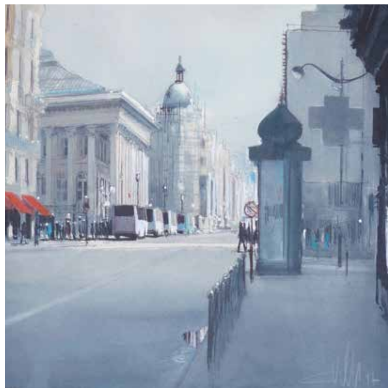
Paris - Rue Reaumur • 26,5x26,5 cm aquarelle et encre sur papier • 2017